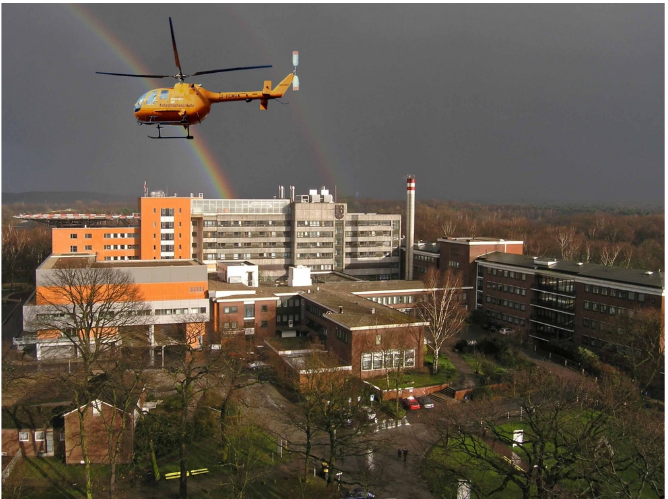
Abbildung: Luftaufnahme der Berufsgenossenschaftlichen Unfallklinik Duisburg GmbH. Der Rettungshubschrauber Christoph 9 ist hier stationiert.